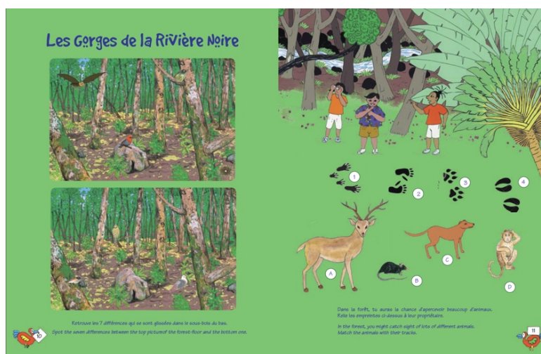
Une double page

Les Éditions VIZAVI publient un livret de jeux bilingue intitulé Sur les pas du Dodo/The Dodo Trail . Chaque page propose aux enfants de découvrir dix lieux emblématiques de l'île Maurice tout en s'amusant. Et c'est Tikoulou qui les accompagne aux quatre coins de l'île. Suivez le guide !